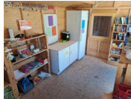
Tauschhaus Mittelschule Reichenaustraße