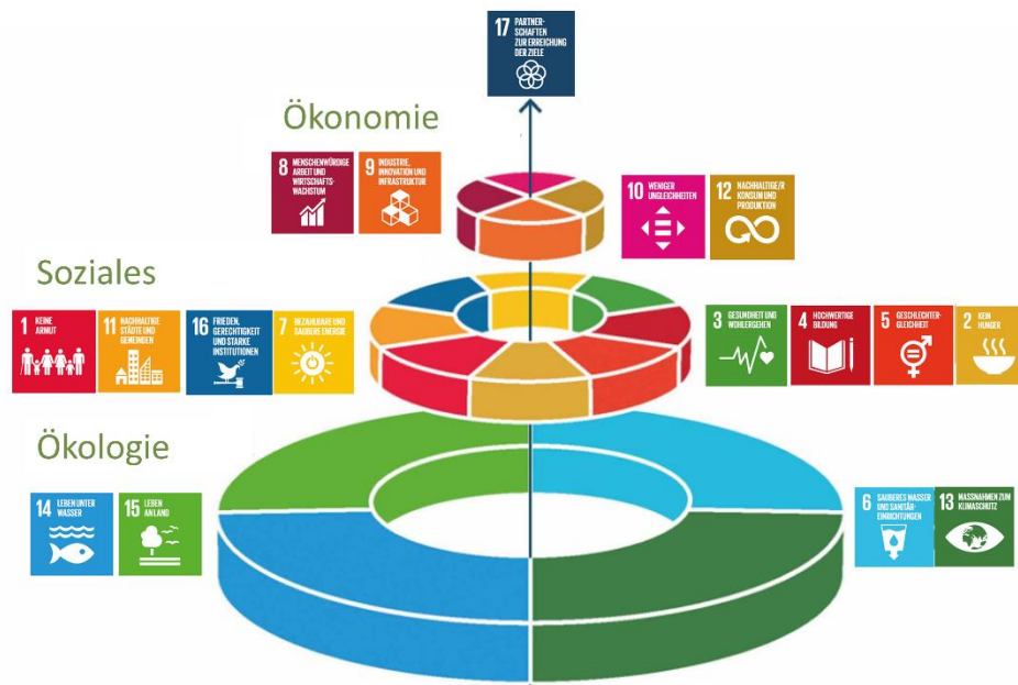
Abbildung 2 Ziele für nachhaltige Entwicklung (vgl. MDPI)