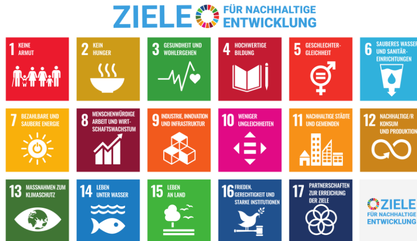
Abbildung 1 Ziele für nachhaltige Entwicklung (Bundesregierung)

Um gemeinsam eine nachhaltige Entwicklung voranzubringen, formuliert die Agenda 2030 unter anderem die 17 Ziele für eine nachhaltige Entwicklung (Sustainable Development Goals, SDGs). Sie konkretisieren die Pfade und Handlungsfelder, in denen Wandel vorangetrieben werden soll.